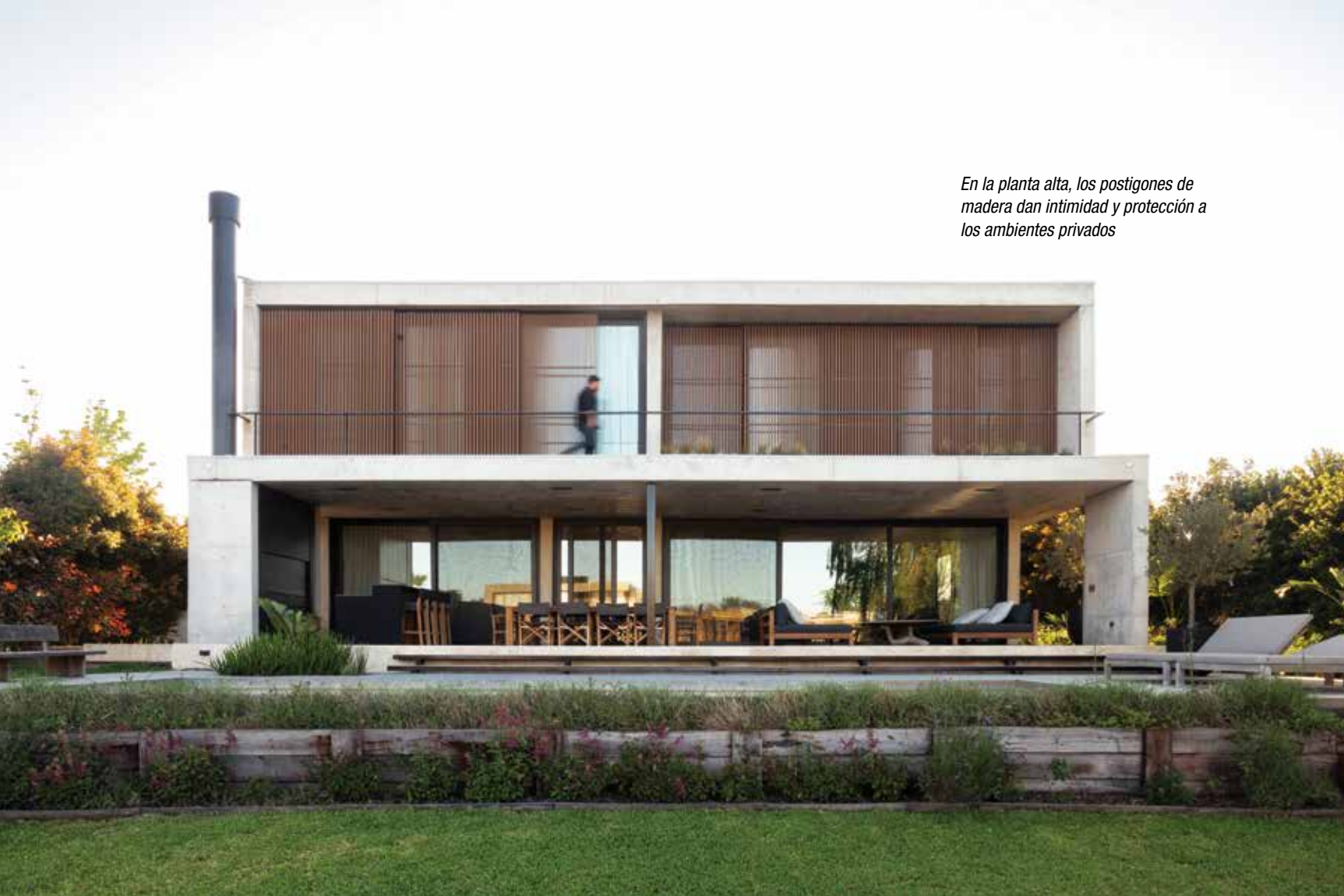
En la planta alta, los postigones de madera dan intimidad y protección a los ambientes privados

En el contrafrente las líneas netas y rotundas trazan dos plantas frontalmente abiertas al jardín y la piscina, con un amplio balcón corrido en el nivel superior y una gran galería semicubierta en la inferior, donde se aloja la zona de parrilla, quincho y un estar social como expansión del living.