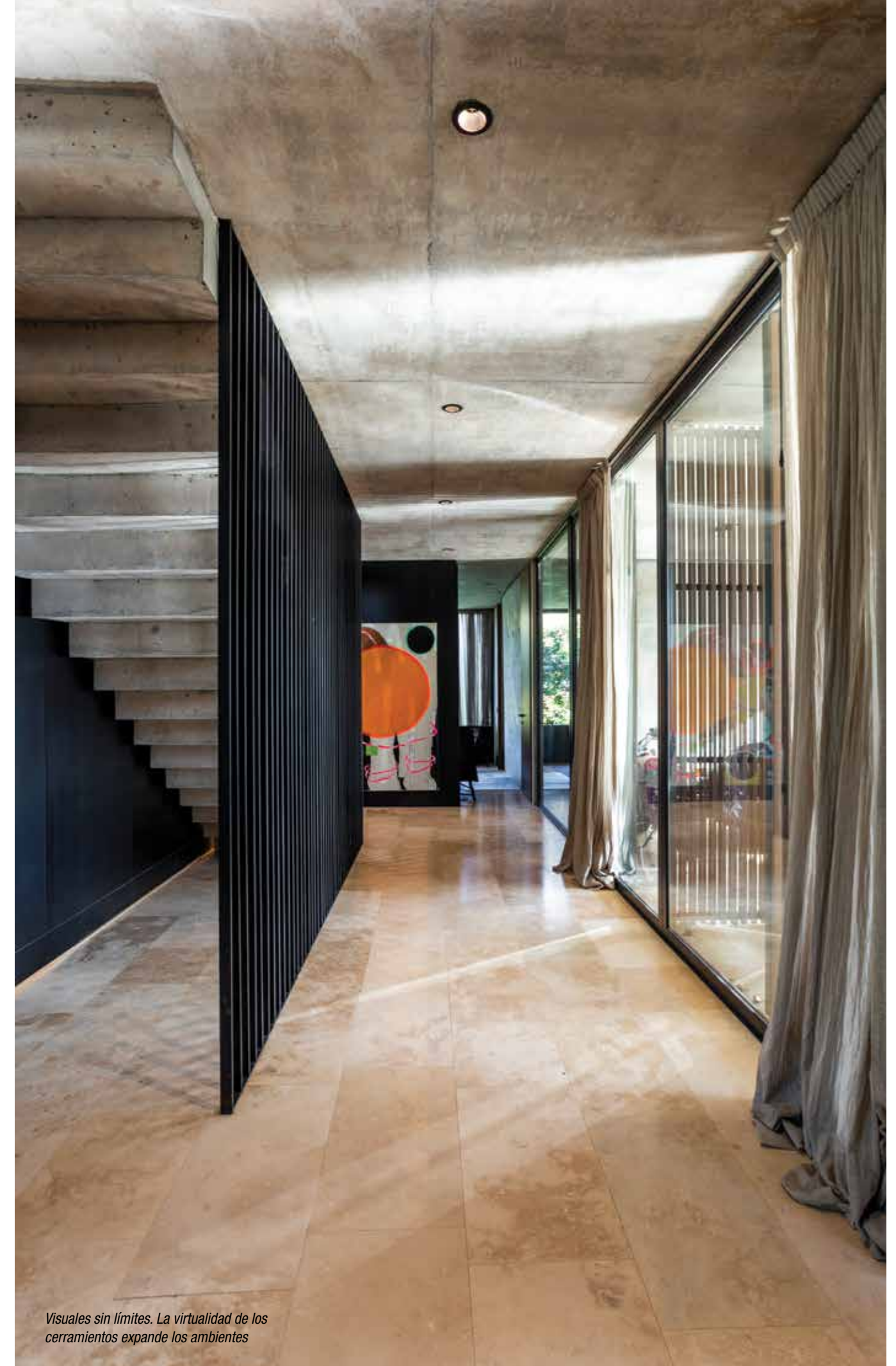
Visuales sin límites. La virtualidad de los cerramientos expande los ambientes